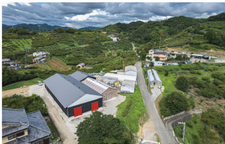
「紀州高出果園 南高梅加工場」