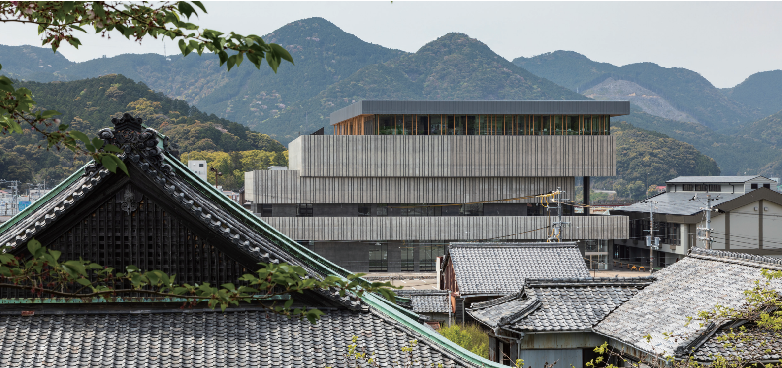
第6回 きのくに建築賞 最優秀賞「新宮市文化複合施設（丹鶴ホール）」 設計：山下設計・金嶋設計共同企業体 施工：村本・三和特定建設工事共同企業体