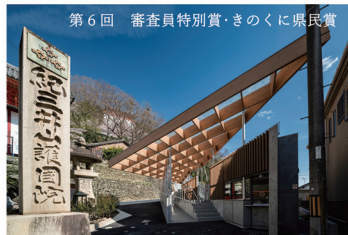
第6回 審査員特別賞・きのくに県民賞

「有田市民水泳場（えみくるARIDA）」 設計：総企画・アトリエアースワーク設計共同 施工：三洋・匠特定建設工事共同企業体